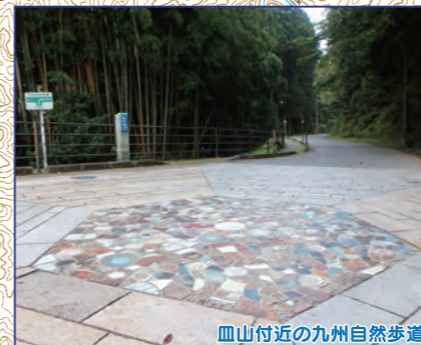
皿山付近の九州自然歩道